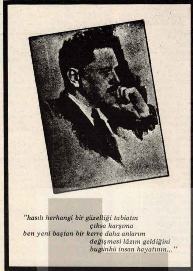
"hasılı herhangi bir güzelliği tabiatın çıkırsa karşına ben yeni baştan bir kerre daha anlarım değişmesi lâzım geldiğini bugünkü insan hayatının..."

İnsanın insan olabilmek için "herşeyden nasibini alması" gerektiğini savunmuştur hep; her şeyden nasibini alıp, bu nasipleme içinde edindiği deneyimi, kültürel birikimi, bir sanatçı olarak en iyi şekilde değerlendirmesi gerektiğini savunmuştur.