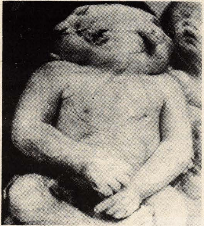
ABD'nin savaş esnasında Vietnam'da kullandığı kimyasal silahlar etkisini bugün dahi gösteriyor.

Bu yılın 14-20 Şubat tarihleri arasında Ho-Chi-Minh şehrinde aralarında doğudan ve batıdan 21 ülkenin 160 bilim adamının katıldığı "Bitki ve yaprak yok etme araçlarının