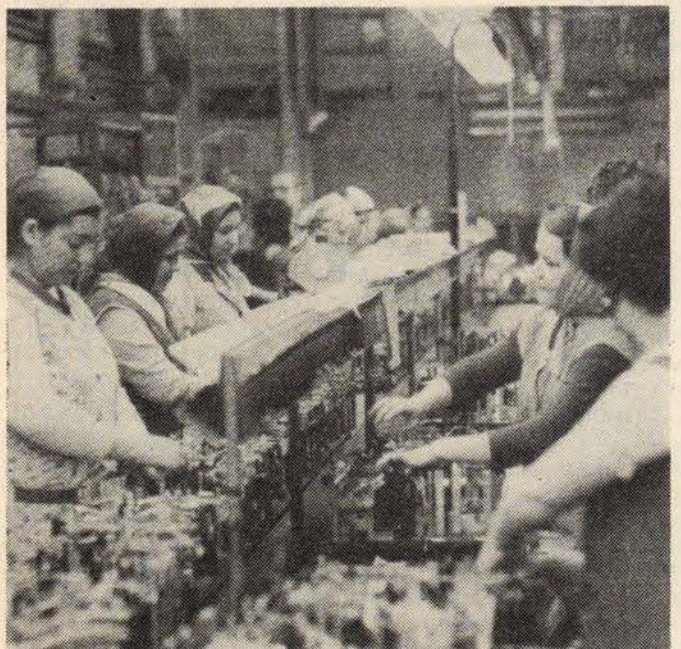
Fabrikada çalışan Türkiye'li göçmen kadın işçiler.

Yanıt: Almanya'ya ailemin yanına bir meslek sahibi olmak ve geleceğimi garanti altına almak için geldim. Ne yazık ki, burada da istediğimiz mesleği elde etme imkânına sahip değiliz. Almanya'ya gelmem hiçbir şeyi değiştirmeyeceği gibi, Türkiye'de kalmam da hiçbir şeyi değiştirmeyecekti. Kısacası ne memleketimizde, ne de burada geleceğimizin garanti altında değildir.